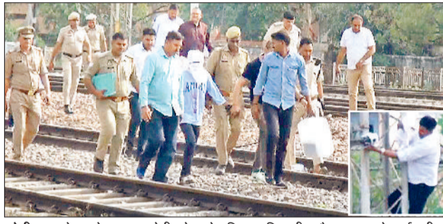
सोनीपत। स्टेशन के पास आरोपी को लाते पुलिस अधिकारी व कैमरा उतारते कर्मचारी।

आरोपी से करीब ढाई घंटे तक की पूछताछ, स्टेशन पर ले जाकर निशानदेही के बाद कैमरा उतारा