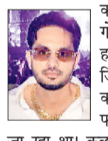
हत्या की गई सरeraह

हरिभूमि न्यूज ►► चंडीगढ़ सेक्टर-9 में बुधवार को प्रॉपर्टी डीलर की सरeraह 12 गोलियों मारकर हत्या कर दी गई। वह जिम में एक्सरसाइज करने के बाद अपनी फॉन्ट्रियर गाड़ी में घर जा रहा था। कुछ ही दूरी पर उसे हमलावरों ने घेरकर ताबड़तोड़