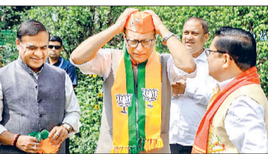
असम के मुख्यमंत्री हिमंत विश्व शर्मा की मौजूदगी में कांग्रेस के नेता एवं मौजूदा सांसद प्रद्युत बोरदोलोई भाजपा में शामिल हुए।

कांग्रेस नेता एवं लोकसभा सदस्य प्रद्युत बोरदोलोई असम के मुख्यमंत्री हिमंत विश्व शर्मा और भारतीय जनता पार्टी (भाजपा) के अन्य नेताओं की मौजूदगी में बुधवार को यहां भाजपा में शामिल हो गए। बोरदोलोई ने कांग्रेस से मंगलवार को इस्तीफा दे दिया था। असम के मुख्यमंत्री ने यहां संवाददाताओं से कहा कि भाजपा के राष्ट्रीय अध्यक्ष नितिन नवीन ने बोरदोलोई के पार्टी में शामिल होने को मंगलवार को मंजूरी दी। असम के मुख्यमंत्री ने कहा कि कांग्रेस के नेता एवं मौजूदा सांसद प्रद्युत बोरदोलोई भाजपा में शामिल हो गए। हमारी प्रदेश इकाई के अध्यक्ष