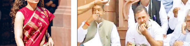
संसद के गेट पर राहुल के चाय-नाश्ता करने को लेकर हो रही आलोचना

इस मामले में 84 पूर्व ब्यूरोक्रेट्स, 116 पूर्व सैनिक और 4 वकीलों ने एक ओपन लेटर लिखकर राहुल गांधी से देश के लोगों से माफी की मांग की है। राहुल गांधी देश में एलपीजी सिलिंडर की भारी कमी को लेकर संसद के गेट पर अन्य सांसदों के साथ विरोध प्रदर्शन कर रहे थे। इस दौरान राहुल गांधी चाय और बिस्किट का आनंद लेते हुए आरामदायर मुझ में बैठे हुए थे, जो विपक्षी सांसदों के लिए आर्क्षण का केंद्र बने। उनका ये अंदाज सोशल मीडिया पर काफी तेजी से वायरल हुआ। सोशल मीडिया पर वीडियो काफी तेजी से वायरल हो रहा है। वीडियो वायरल होने के बाद कुछ लोगों ने इस्पर प्रतिक्रिया देनी शुरू की।