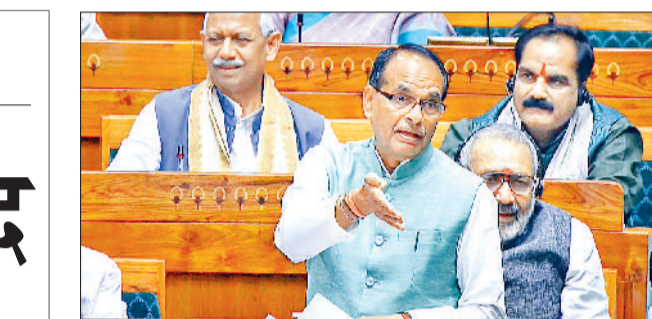
कृषि मंत्री शिवराज का लोकसभा में कांग्रेस पर कटाक्ष

इस मामले में 84 पूर्व ब्यूरोक्रेट्स, 116 पूर्व सैनिक और 4 वकीलों ने एक ओपन लेटर लिखकर राहुल गांधी से देश के लोगों से माफी की मांग की है। राहुल गांधी देश में एलपीजी सिलिंडर की भारी कमी को लेकर संसद के गेट पर अन्य सांसदों के साथ विरोध प्रदर्शन कर रहे थे। इस दौरान राहुल गांधी चाय और बिस्किट का आनंद लेते हुए आरामदायर मुझ में बैठे हुए थे, जो विपक्षी सांसदों के लिए आर्क्षण का केंद्र बने। उनका ये अंदाज सोशल मीडिया पर काफी तेजी से वायरल हुआ। सोशल मीडिया पर वीडियो काफी तेजी से वायरल हो रहा है। वीडियो वायरल होने के बाद कुछ लोगों ने इस्पर प्रतिक्रिया देनी शुरू की।